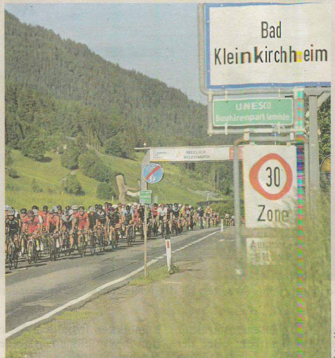
Tolle Kulisse beim Radmarathon in Bad Kleinkirchheim

Organisator Norbert Unterköfler. Denn hinunter geht's dann entspannt auf Europas längstem Flow Country Trail 15 km bis nach Bad Kleinkirchheim. Die Zeitmessung gibt's auch beim Sideevent nur am Berg. Für Teilnehmer des Radmarathons am Sonntag ist der Startplatz beim MTB-Event zudem kostenlos.