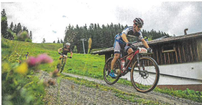
Zwischenabfahrt beim M3 Montafon-MTB Marathon.