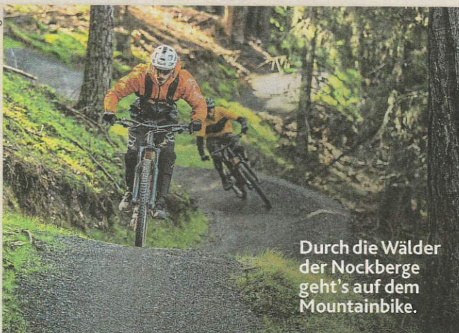
Durch die Wälder der Nockberge geht's auf dem Mountainbike.